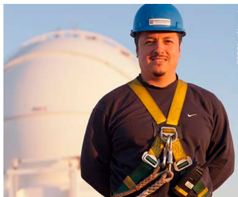
Técnico electrónico trabajando en el UTH.

Los Miembros del Personal Local asignados a un observatorio recibirán vestimenta y calzado de trabajo adecuados, según recomendaciones de la Comisión de Seguridad.