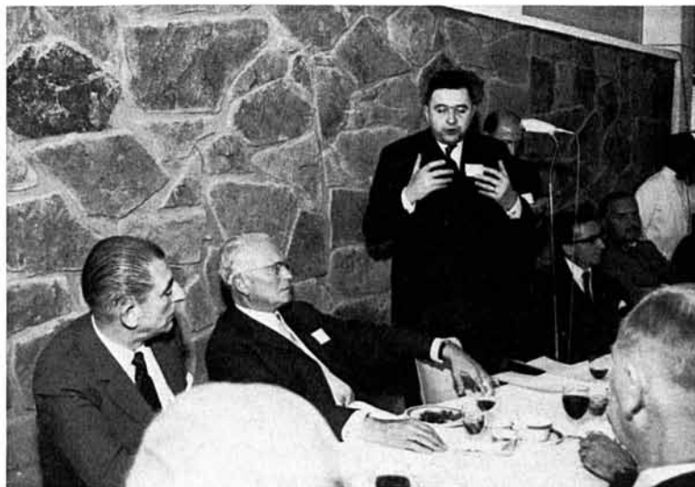
Fig. 4 : M. Jacques Trorial, Ministre, Ministère de l'Education Nationale en France, au cours de l'inauguration s'adresse à l'assistance durant le repas suivant l'inauguration officielle.