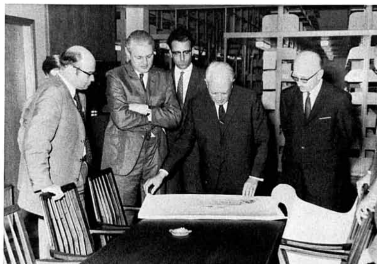
Fig. 5 : Après les cérémonies d'inauguration, le Ministre de la Recherche scientifique allemand, le Dr. Gerhard Stoltenberg, visite les Etablissements de l'ESO au Chili. Le Dr. Stoltenberg (le 4ème en partant de la droite) avec le Professeur Heckmann, Directeur général de l'ESO (le second en partant de la droite) dans la bibliothèque de l'ESO.