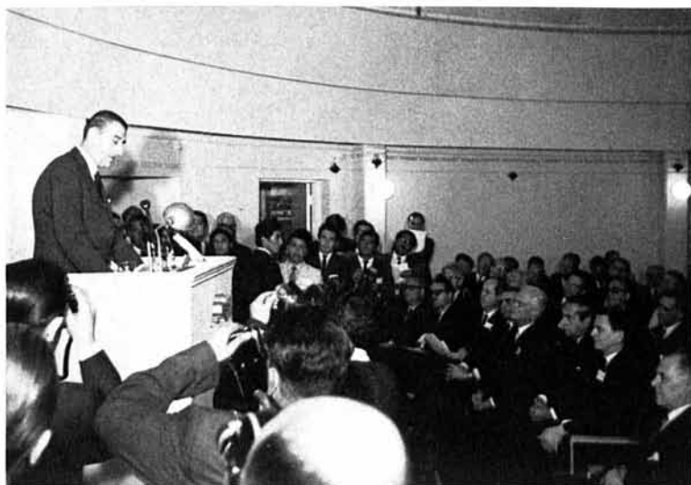
Fig. 1 : Le Président de la République du Chili, Eduardo Frei M., inaugura l'Observatoire ESO le 25 mars 1969.